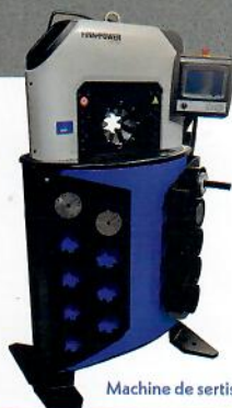
Machine de sertissage FP120

OCS2-MALICO LAC se dote d'un banc de traction GILDABINI , qui vient compléter notre machine de sertissage FP120 , afin de délivrer des certificats de conformité selon EN 10204 , et ainsi garantir les conditions de sertissage.