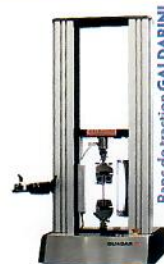
Banc de traction GILDABINI

OCS2-MALICO LAC se dote d'un banc de traction GILDABINI , qui vient compléter notre machine de sertissage FP120 , afin de délivrer des certificats de conformité selon EN 10204 , et ainsi garantir les conditions de sertissage.